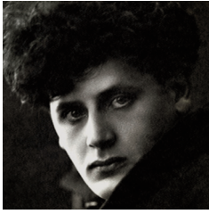
Peretz Markish פרץ מאַרקיש