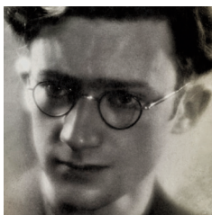
Avrom Sutzkever אַבְרָהָם סוּצְקֵעווער