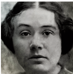
Anna Margolin אַנאַ מאַרגאָלין

Peretz Markish (1895-1952), né en Ukraine, s'installe à Kiev en 1918 après avoir servi dans l'armée impériale. La même année, il rejoint le groupe de poètes yiddish avant-gardiste de Kiev et emménage ensuite à Varsovie, où il devient le co-fondateur du journal d'avant-garde Khalyastra . Il séjourne à Berlin et à Paris et, à partir de 1926, vit en Union Soviétique. Il est particulièrement connu pour le long poème Di kupe (« Le Tas », 1921), évocation expressionniste des pogrommes de 1920-1921 en Ukraine. Le 12 août 1952, sous la répression stalinienne, il est fusillé avec douze autres intellectuels juifs yiddishophones.