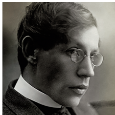
Moyshe-Leyb Halpern משה-לייב האלפערן

Yehoyesh , de son vrai nom Solomon Blumgarten (1872-1927), est un poète et traducteur yiddish et hébraïque. Fils d'un rabbin, il reçoit une éducation religieuse traditionnelle. Très jeune, il se met à écrire de la poésie tardive en hébreu. En 1890, il s'installe aux États-Unis où il entreprend son œuvre maîtresse, une traduction de la Bible en yiddish moderne qu'il veut à la fois fidèle au sens et respectueuse du ton et du rythme de l'original, tout en poursuivant son œuvre de poète. Sa poésie tardive en yiddish fait de lui un précurseur du groupe poétique d'avant-garde Di inzhikhistrn (« Les introspectivistes »).