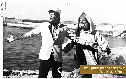
השותפה 'החוקק באטון' מול הנהלים "שבול"